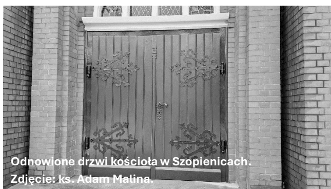
Odnówione drzwi kościoła w Szopienicach.