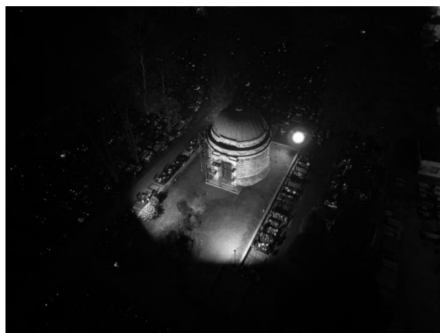
Mauzoleum Dietla zyskało nocną iluminację.